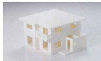
Value3D MagiX MFシリーズ